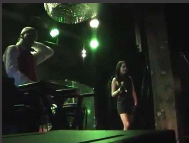
Live – « True Faith » (New Order cover) – Le Réservoir, Paris