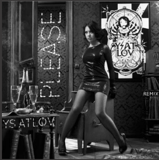
Please – EP (2015)