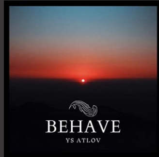
Behave – EP (2020)