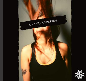
All the sad parties – Single (2021)