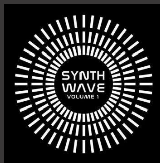
Synth Wave vol. 1 – Compilation (2016)